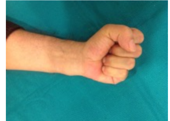
Ameliyat sonrası tam kapatma