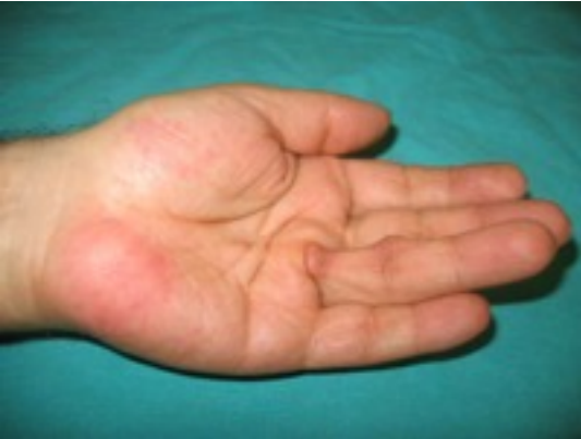
Sol taraf ameliyat öncesi