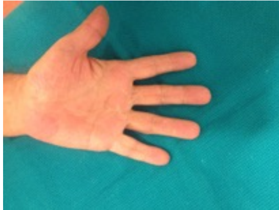
Ameliyat sonrası tam açma