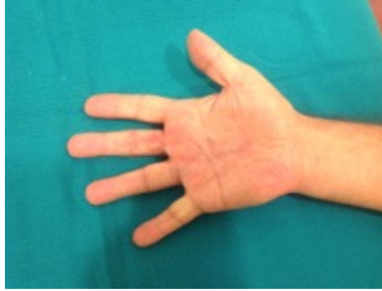
Ameliyat sonrası tam açma