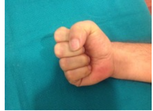
Ameliyat sonrası tam kapatma